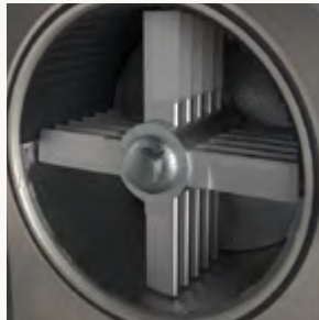
روتور تیغه ای

پلاستیک ها، پلیمرها و مواد فیبری مانند پلی پروپیلن PP، پلی اتیلن HDPE، پلی کربنات PC، پلی وینیل کلراید PVC، پلی اورتان گرمانرم (ترموپلاستیک) TPU، پلی آمید PA، نایلون، پلی اترکتون PEEK، اتیلن وینیل الکل EVA، پلی استایرن PS و ABS